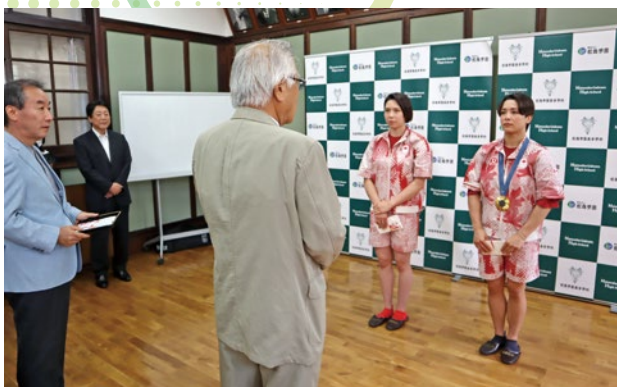
オリンピック出場の報告会（松商学園）

文武両道を目指す松商学園の基本方針を象徴するかのような今回のイベントが国内での武の部門にもたらすインパクトは計り知れないものがあります。今後も他の運動部の皆さんの活躍を期待したいと思います。